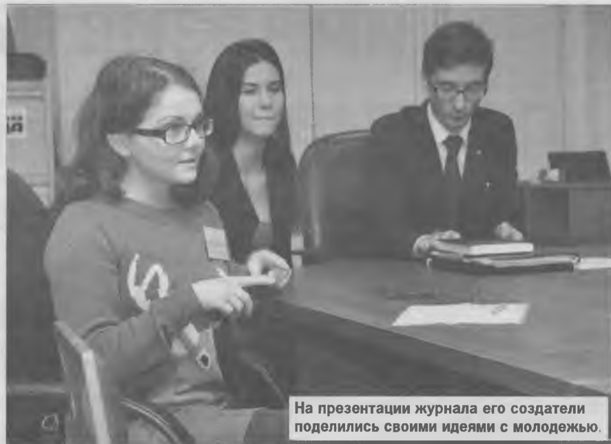
На презентации журнала его создатели поделились своими идеями с молодежью.