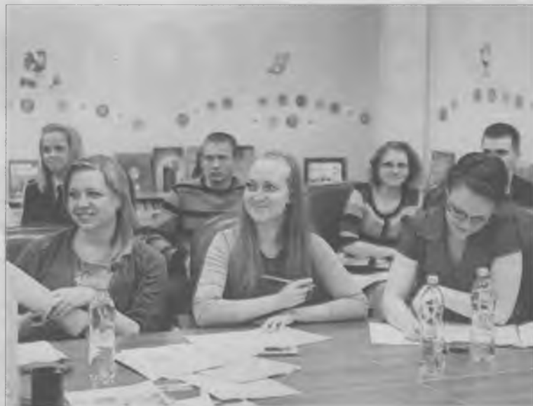
Члены жюри приятно удивлены энтузиазму студентов.