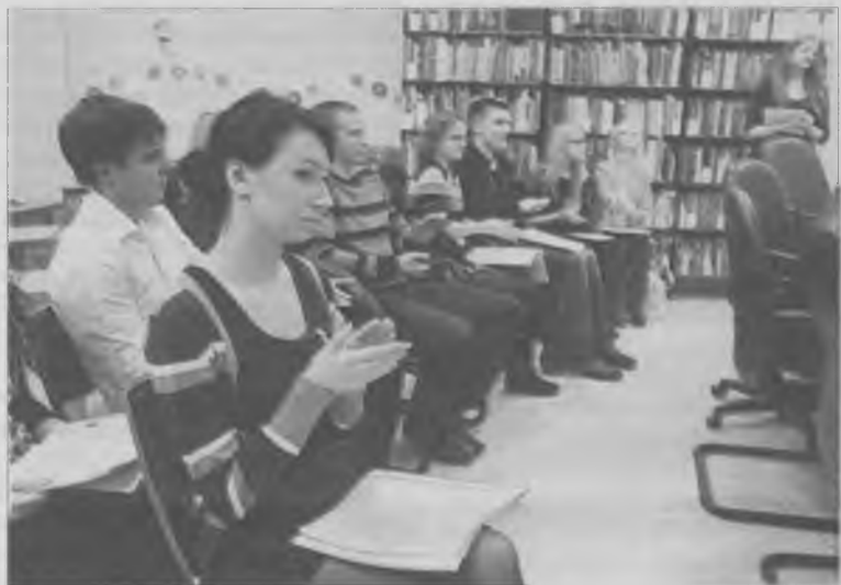
Рассказать о проекте легко, трудно будет его реализовать.