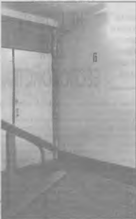
Так сегодня выглядит подъезд, отремонтированный неделю назад.