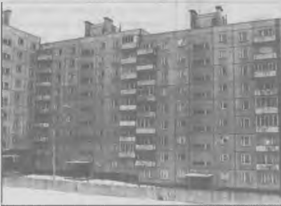
В этом доме мы побывали.