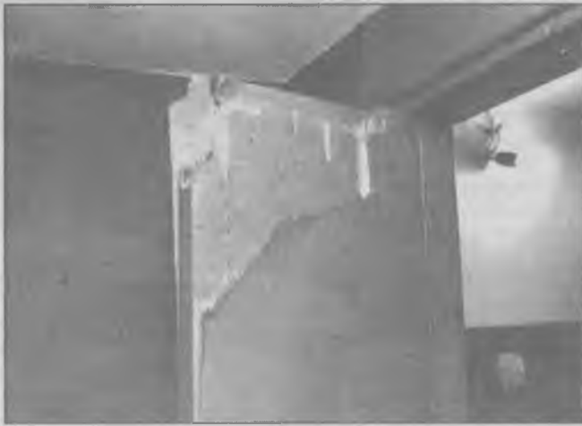
А так - отремонтированный двумя месяцами раньше.

ПОДПИСНАЯ ЦЕНА НА "ВЕЧЁРКУ" НА ОДИН МЕСЯЦ (С ДОСТАВКОЙ) - 18030 рублей.