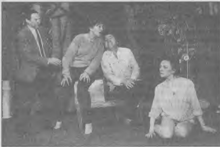
Репетиция спектакля "Темные истории".