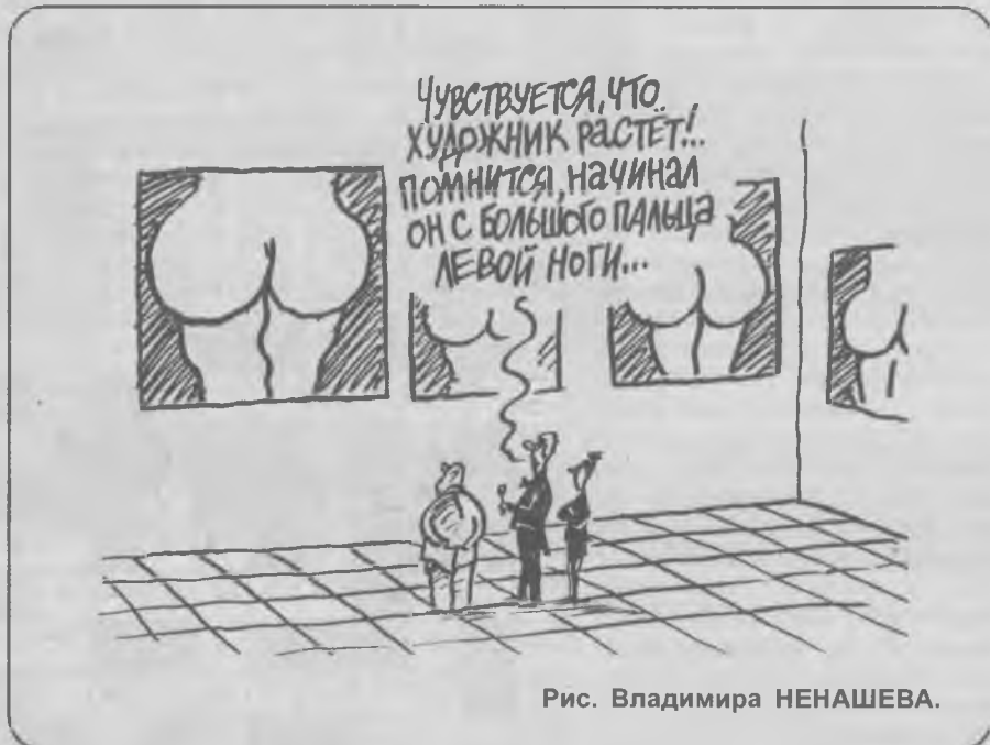
Рис. Владимира НЕНАШЕВА.