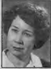
С любовью родные, близкие и друзья.

Поздравляем с юбилеем любимую маму, бабушку, тещу. Желаем счастья и тепла, любви и радости и света. Пусть не болеет никогда, цветет и пахнет, как Джульетта.