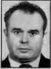
Любящие жена, дети, внуки.

Папа, родной наш, любимый, дедушка славный, незаменимый! С днем рождения тебя поздравляем и важных благ желаем. Чтоб ты никогда не болел, чтоб ты никогда не старел. Чтоб вечно ты был молодым, мудрым, добрым и нежным таким.