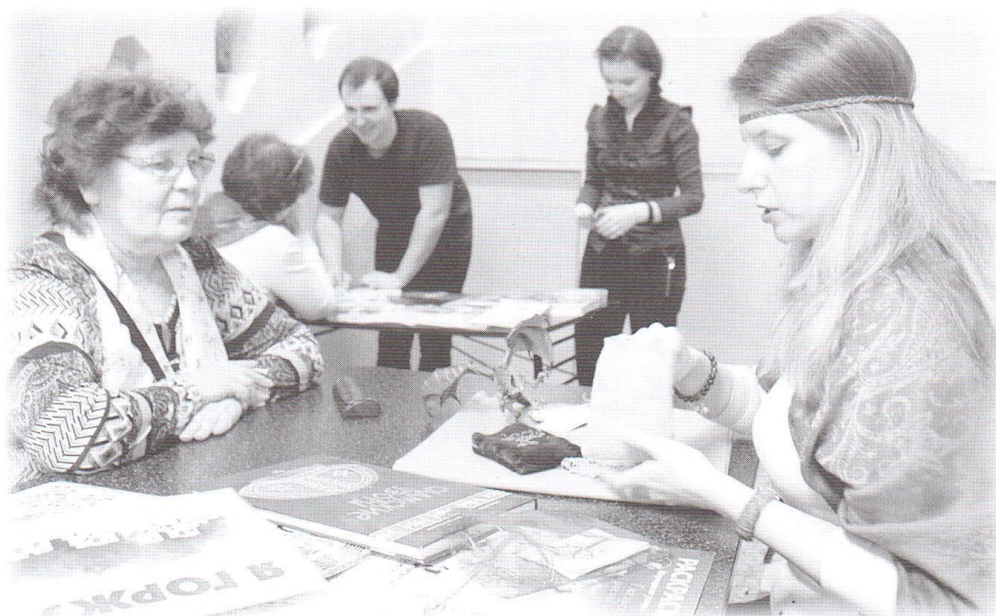
Акция «Ночь музеев»

помогавшего сделать чтение выразительным и подбирившего музыкальное оформление.