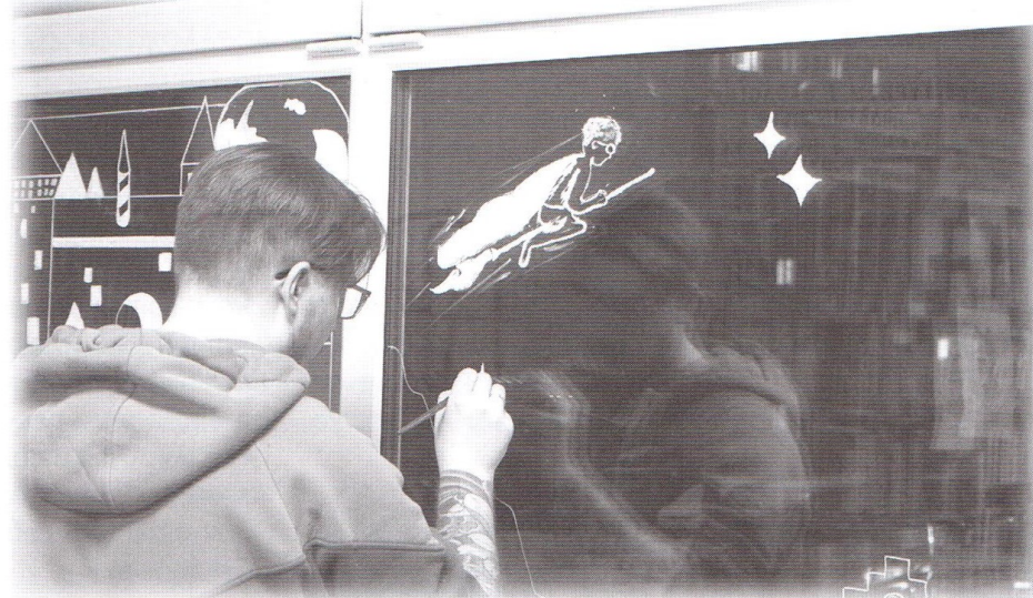
Участник акции «Новогодние окна»