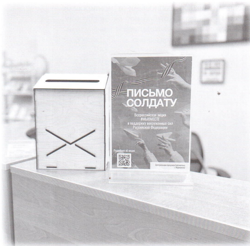
Акция «Письмо солдату»

здравоохранения проходить в день от 6000 до 10 тыс. шагов для поддержания минимума нормальной физической активности человека. В нашей библиотеке регулярно проходят уличные экскурсии по городу, фотоквесты, велопробеги, поэтому одну из экскурсий мы решили провести специально под эгидой этой акции с регистрацией участников на сайте организаторов. Маршруты любых таких прогулок мы начинаем в библиотеке – точке общего сбора, где все желающие могут познакомиться с её услугами, найти для себя что-то интересное и записаться.