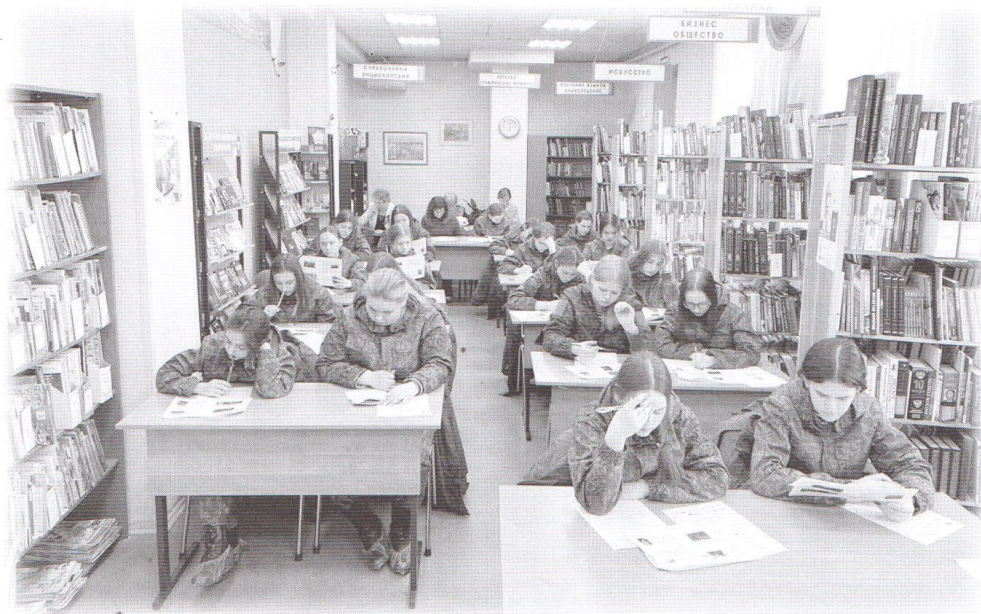
Акция «Диктант Победы»

Акции объединяют участников и в интернет-пространстве, используются специальные хештеги, переходя по которым можно видеть работу коллег из других городов и регионов. Пользова-